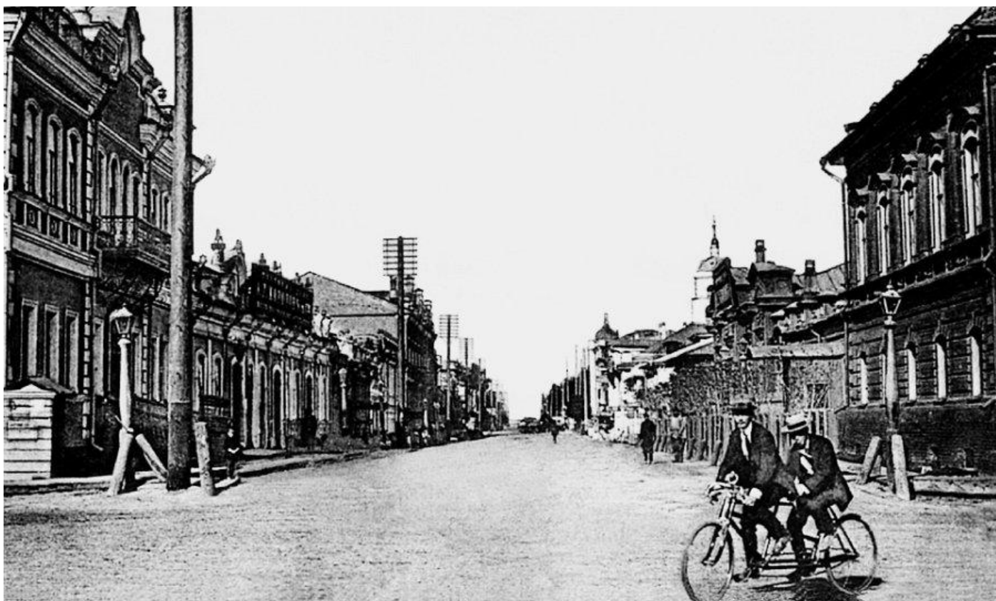
Барнаул в начале XX века

Большинство старых сибирских городов возникло как остроги – Тюмень, Тобольск, Томск, Омск, Красноярск, Иркутск. В этом длинном ряду Барнаул стоит особняком – он изначально был заводом, а не крепостью. Акинфий Демидов – второй в роду крупнейших российских промышленников, счёл место на реке Барнаулке удобным для строительства сереброплавильного завода: здесь был лес и была вода. Заводской посёлок рос быстро и вскоре обогнал Колывань, недолгий период главенствовавшую на юге Западной Сибири.